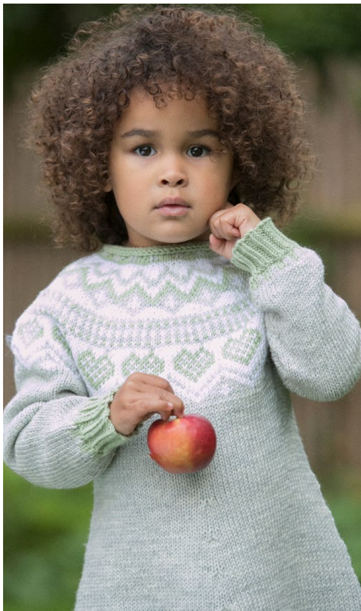
Lisa kjole lys pistasje, se oppskrift MG 03-02

Sy sammen under ermene. Sy sammen endene av I-cord kanten på opplegg og halsfelling.