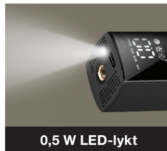
0,5 W LED-lykt